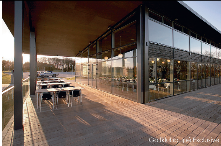
Golfklubb, Ipé Exclusive