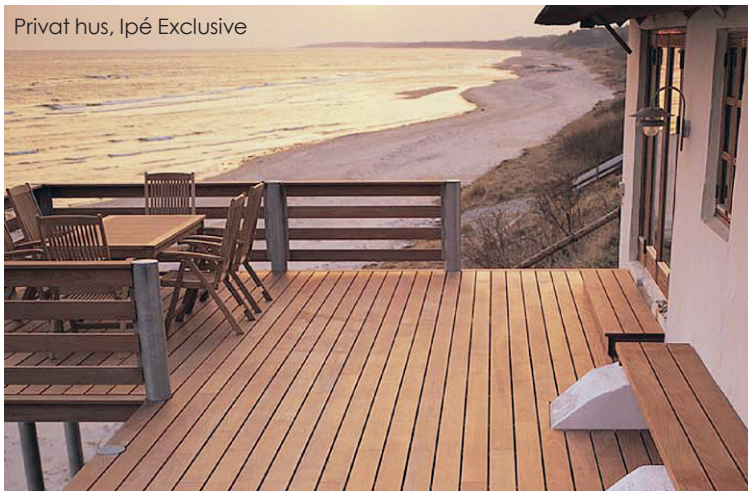
Privat hus, Ipé Exclusive