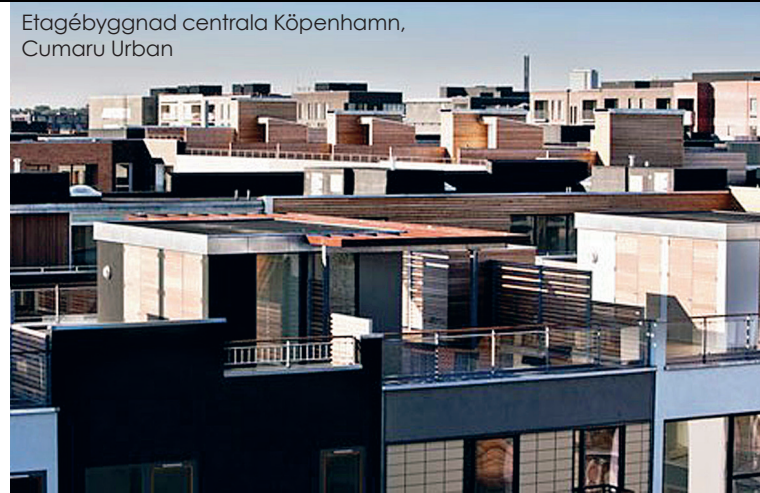
Etagébyggnad centrala Köpenhamn, Cumaru Urban